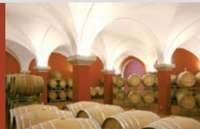
▲ Weingut Spieß, Bechtheim 2007 Neubau